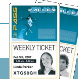
Forfaits de Ski